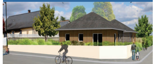
Distré ZAC «Sous la Bosse» - 2 logements 1 er trimestre 2022