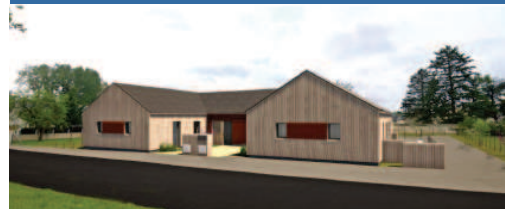
Brain-sur-Allonnes 2 logements inclusifs BEPOS 4 ème trimestre 2022