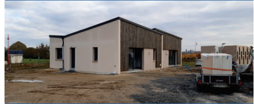
Saint-Georges-sur-Layon Le Clos Davy - 7 logements 2 ème trimestre 2022