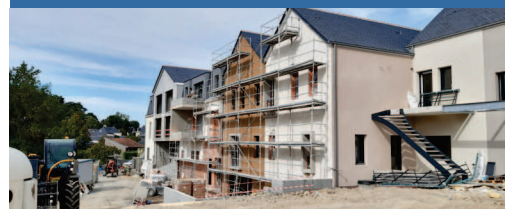
Gennes-Val-de-Loire Îlot du Moulin - 12 logements 2 ème trimestre 2022