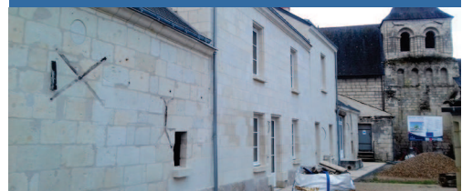
Villebernier Ancien presbytère - 4 logements 2 ème trimestre 2022